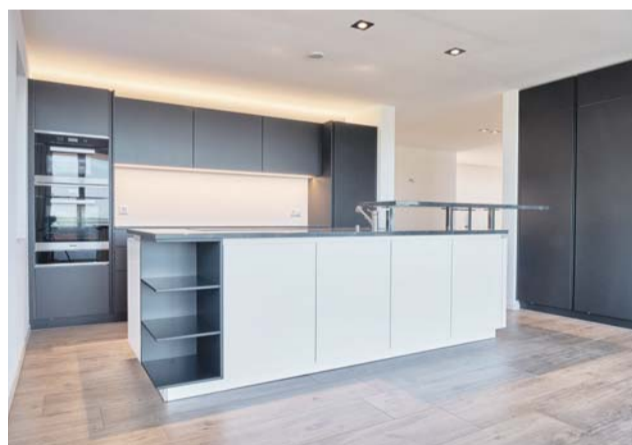
Die stilvolle offene Küche lässt keine Wünsche mehr offen.