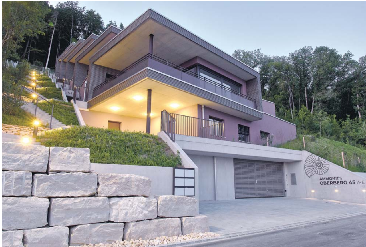
Die moderne Architektur der Überbauung Ammonit in Beringen fügt sich optimal in die steile Hanglage ein.