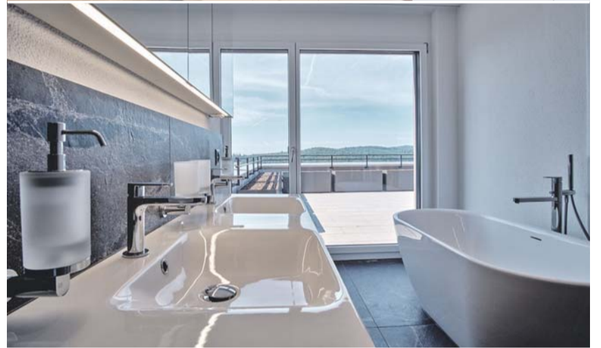
Verschiedene Ansichten in der Überbauung Ammonit in Beringen.