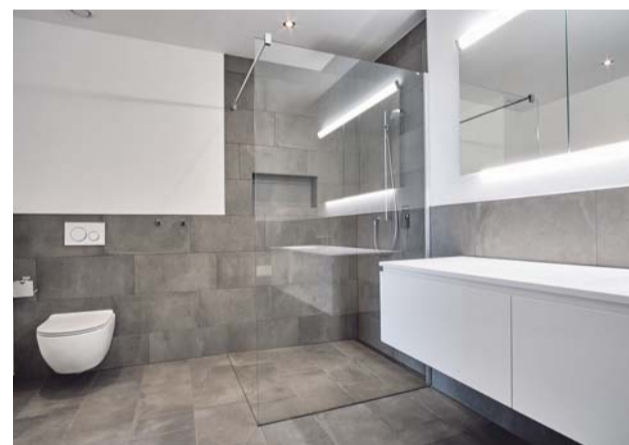
Das Badezimmer ist als moderner Wohlfühlraum ausgestattet.