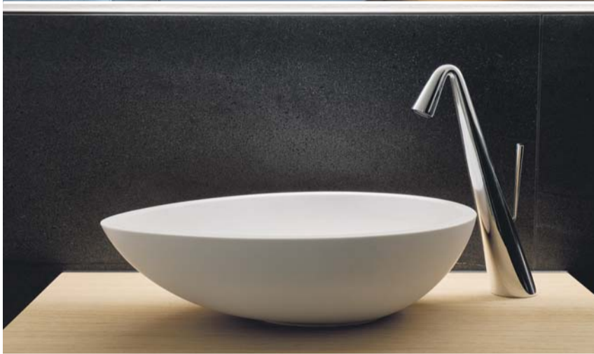
Alle Terrassenhäuser konnten individuell und massgeschneidert ausgebaut werden.